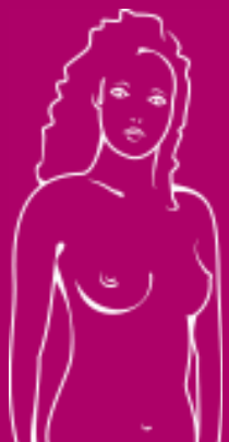
z rękami wzdłuż ciała