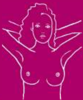
z rękami za głową