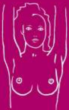
z rękami uniesionymi